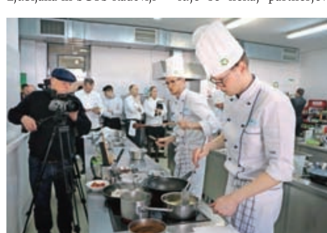
Letos je SGTŠ Radovljica gostila tretje predtekmovanje za Tuševo kuharsko zvezdo 2017. Na njem se je pomerilo devet ekip.

ce, tokrat pa je med devetimi tekmujočimi uspela uvrstitev naprej Ljubljancanom in Celjanom. Tekmovalce so ekipe SŠ Izola, SŠ Zagorje, SŠGT Celje, SŠGT Radenci, SŠGT Novo mesto, SŠGT Ljubljana in SGTŠ Radovljica, ki so strokovni žiriji in obiskovalcem postregle z zanimivim izborom lokalnih jedi.