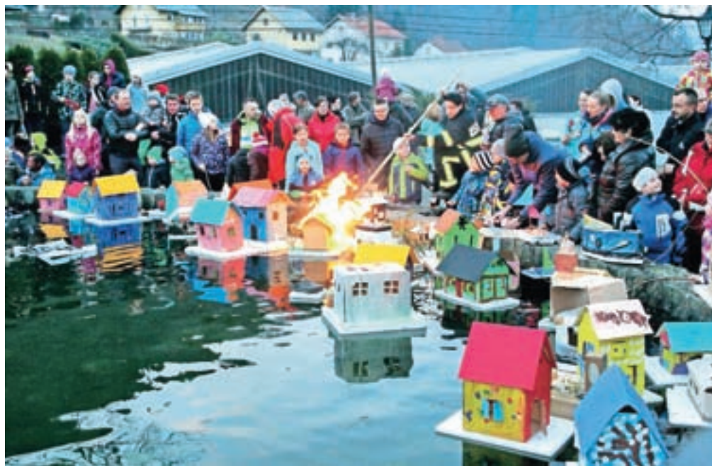
V Kropi so barčice spuščali v bajer, našli so jih okrog 130, nekaj pa se jih je žal vnelo.

dije in druženje. Kot je povedala, je tudi sama zrasla ob izdelovanju barčic in doma jih imajo ohranjenih kar nekaj iz obdobja zadnjih štiridesetih let. V Kropi s spuščanjem barčic pozdravijo sonce, ki se v začetku novembra za dobre štiri mesece poslovi. »Sonce se v različne predele Kroke vrača od 17. januarja pa tja do 15. marca. Prihod sonca so Kroparji praznovali tako, da so zvečer, ko se je začelo mračiti ob vigenjcu, kjer so delali, vrgli luč v vodo. To je bila nekdanja stara cokla, pehar ali pa sito, vanj so dali žaganje, oblance, vse skupaj so prelili s smrekovo smolo, zažgali in vrgli v vodo.« je o tradiciji dodala Kavčičeva.