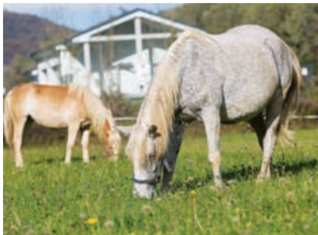
Okoljska dajatev je namenjena izboljšanju infrastrukture za odvajanje odpadne vode v občini.

Zavezanec za plačilo okoljske dajatve zaradi odvajanja komunalne odpadne vode je pravna ali fizična oseba, ki je uporabnik stavbe (lastnik, najemnik ali druga oseba, ki uporablja stavbo ali del stavbe), v kateri nastaja komunalna odpadna voda, in onesnažuje okolje z odvajanjem te vode (v greznico, kanalizacijo, malo komunalno čistilno napravo (MKČN) oz. neposredno v okolje). Obveznost plačila okoljske dajatve obenem velja za vse stalno in začasno prijavljene prebivalce v stavbi na območju