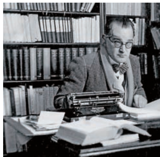
Profesor Furlan na univerzi