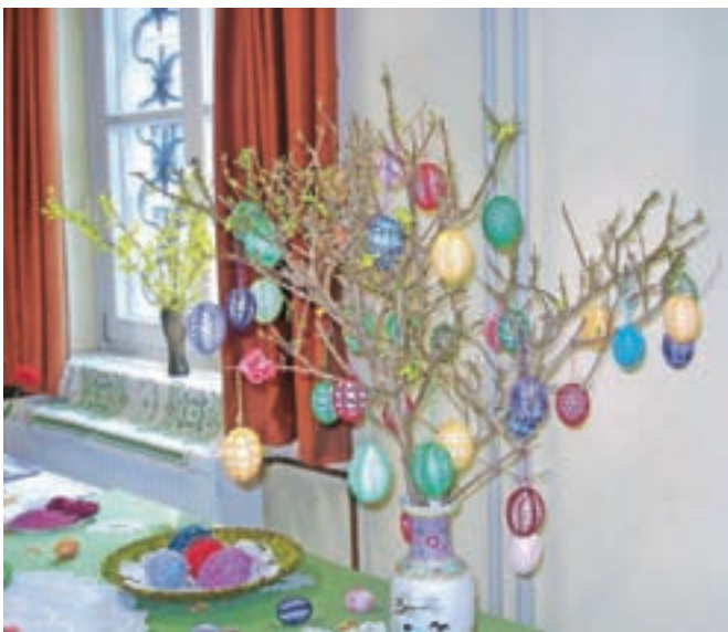
Razstava je bila na ogled od 24. do 26. marca.