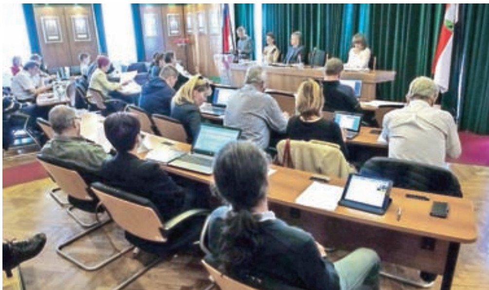
Občinski svet je na seji prejšnjo sredo soglasno potrdil prometno strategijo občine.

Strokovne službe, ki so pripravile dokument, so posebej poudarile, da so si v procesu priprave prizadevali za čim večje sodelovanje javnosti, in tako so med drugim z anketo prišli do podatkov, da so občani na področju prometa najbolj nezadovoljni z varnostjo in (ne)sklenjenostjo kolesarskega omrežja ter (ne)varnimi potmi v šolo, to dejstvo pa je bilo tudi ena od osnov za pripravo ukrepov. Kot je med drugim zapisano v dokumentu, ki veliko