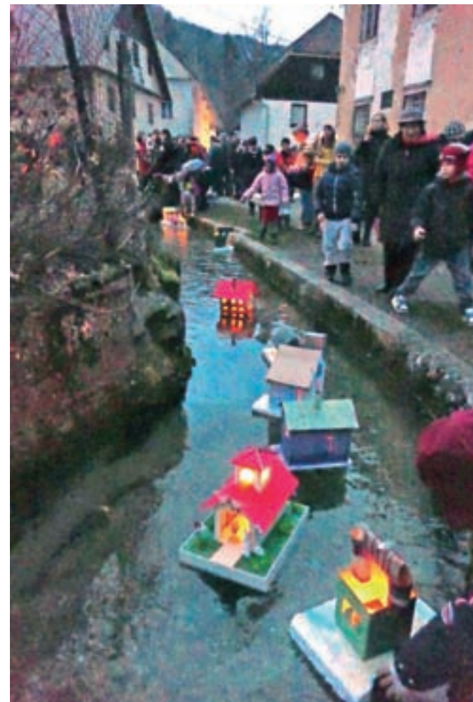
Gregorjevo v Kropi in Kamni Gorici, avtor Justin Zorko, 3. nagrada