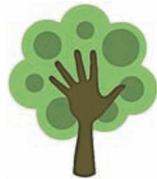
Očistimo našo občino - Radovljica 2016

Napovedana zborna mesta v občini Radovljica: Brezje (glavno parkirišče), Kropa (kulturni dom), Lancovo (zadružni dom), Lesce (restavracija Center), Mošnje (pri krajevnem muzeju), Otok (prostori KS), Podnart (kulturni dom), Radovljica (gasilski dom). V akciji sodelujejo tudi šole in vrtci v občini. Učenci OŠ Staneta Žagarja Lipnica in PŠ Ovsiške so okolico obeh šol in šolske poti očistili v